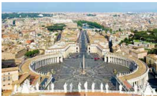
Rom vom Petersdom aus gesehen

Der obengenannte Reisepreis ist vergleichsweise günstig, setzt aber voraus, dass mindestens 30 Personen mitfahren. Bisher haben sich 18 Teilnehmer/innen gemeldet. Es wäre schön, wenn sich noch weitere Teilnehmereinsteiger (Freunde, Verwandte oder Bekannte unserer Gemeindemitglieder sind willkommen) möglichst bald im Pfarrbüro Tel. Nr. (06181) 24466 melden würden, damit die Voraussetzungen für die Durchführung der Reise geschaffen werden. Im Pfarrbüro kann auch das vollständige Reiseprogramm angefordert werden.