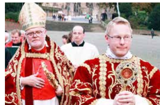
Kardinal Marx und Diakon Jens Körber vor dem Fuldaer Dom

Herzliche Einladung zur Priesterweihe im Fuldaer Dom am Pfingstsonntag, 23.05.15 um 9.30 Uhr. Herzliche Einladung auch zur Primiz am Pfingstmontag, 25.05.15 um 10 Uhr in meiner Heimatpfarre St. Martin, in 36157 Schmalnau. Meine Nachprimiz in St. Elisabeth feiere ich zum Kirchweihfest am So., 30.08.15 um 10.30 Uhr.