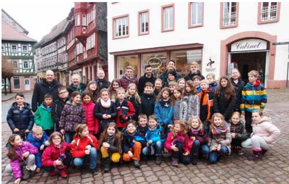
Die Kommuniongruppe mit Betreuern in Miltenberg