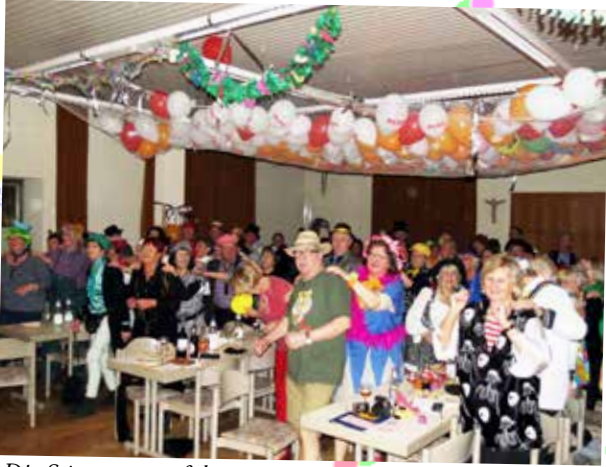
Die Stimmung auf dem Piratenschiff war großartig