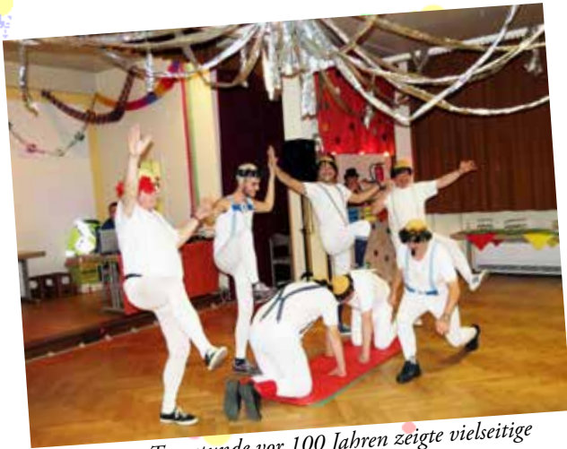
Die Männer-Turnstunde vor 100 Jahren zeigte vielseitige und witzige Akrobatik

Auch die „Kleinen“ kamen groß raus – an zwei Nachmittagen gab's Kinderfasching.