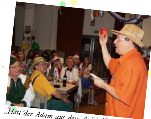
„Hätt' der Adam aus dem Apfel doch Äppelwoi gemacht!“