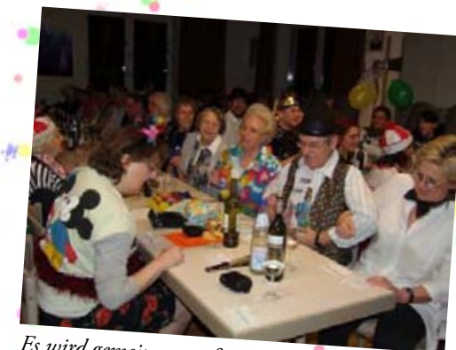
Es wird gemeinsam gefeiert und viel gelacht