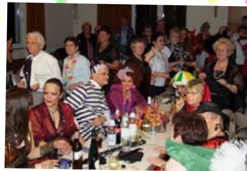
Tolle Stimmung beim Gemeindefasching