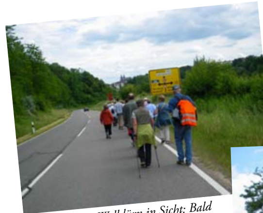
Die Basilika in Walldürn in Sicht: Bald am Ziel