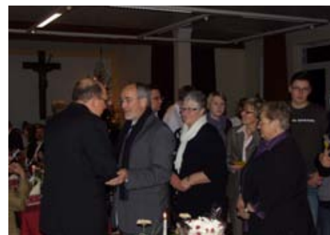
Eine lange Reihe von Geburtstagsgratulanten