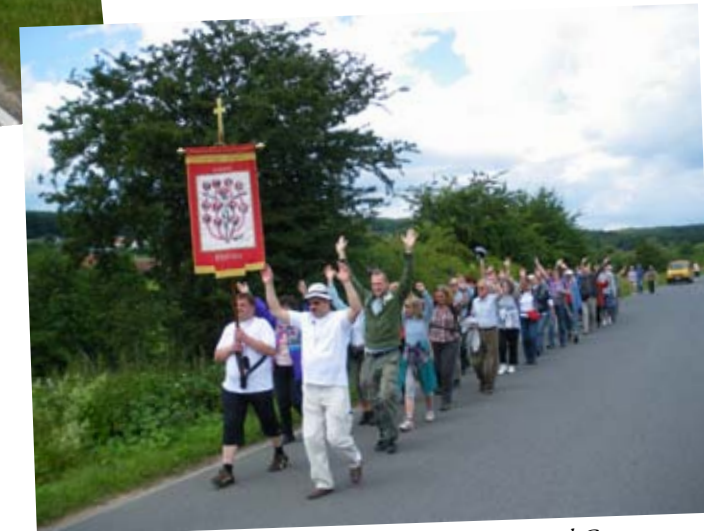
Die Hände zum Himmel: Beten mit allen Sinnen und Gesten