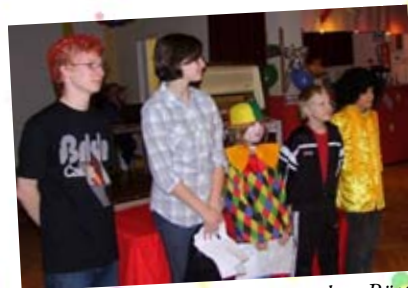
Unsere Messdiener-Akteure in der „Bütt“