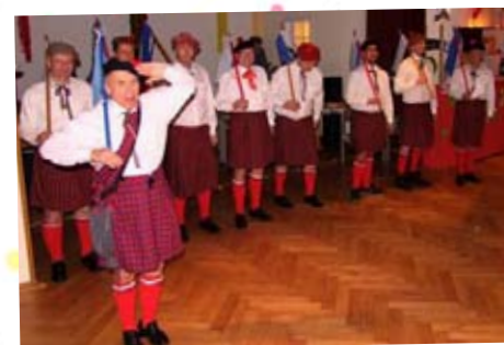
Die Schottengarde von St. Elisabeth ist angetreten.