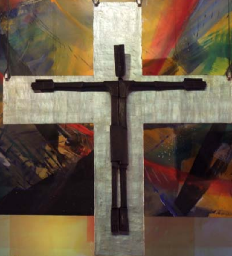
Foto: Das Kreuz der St. Elisabeth-Kirche Hanau vor der Osterfahne

Informationen der Katholischen Pfarrgemeinde St. Elisabeth Hanau Ostern 2011