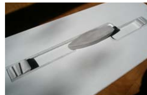
Das Modell der Skulptur aus Holz und Stein

Eine „Kleinigkeit“ wäre noch zu regeln, meint Pfarrer Weber, nämlich die Finanzierung, welche die Gemeinde ganz allein stemmen müsse. Die entsprechende Sammelbüchse enthalte zwar schon etliche tausend Euro, noch wäre allerdings ein weiter Weg zurückzulegen.