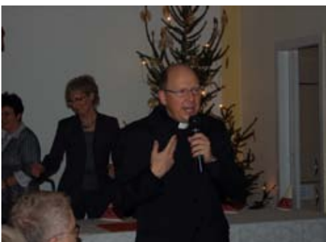
Das Geburtstagskind begrüßt seine Gäste im Pfarrers-Karl-Schönhals-Haus