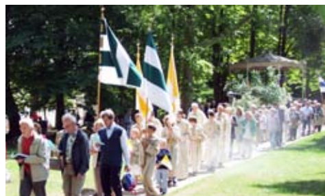
Jährliche Prozession an Christi Himmelfahrt