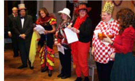
Das Pfarrbüro war in bester Laune