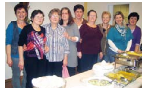
Das Bewirtungsteam von St. Elisabeth am Weltgebetstag

Hier wurde man von einer schmackhaften, durch unsere Blumenfrauen vorbereiteten, malayischen Küche überrascht. Die zahlreichen Besucher konnten an wunderschön, in landestypischen Farben, dekorierten Tischen Platz nehmen. Es war ein sehr gelungener Abend, an dem unsere Blumenfrauen sich in ihrer kulinarischen Begabung allem bis dahin Bekannten weit übertroffen haben. Ihnen allen herzlichen Dank!