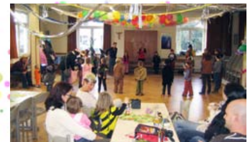
Aufgepasst - jetzt wird gespielt!