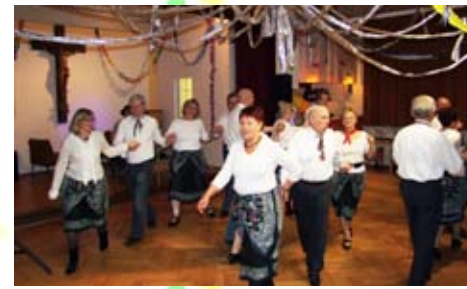
Die Tänzerinnen und Tänzer beim Zillerthaler Hochzeitsmarsch in Aktion