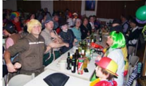
Tolle Stimmung beim Gemeindefasching