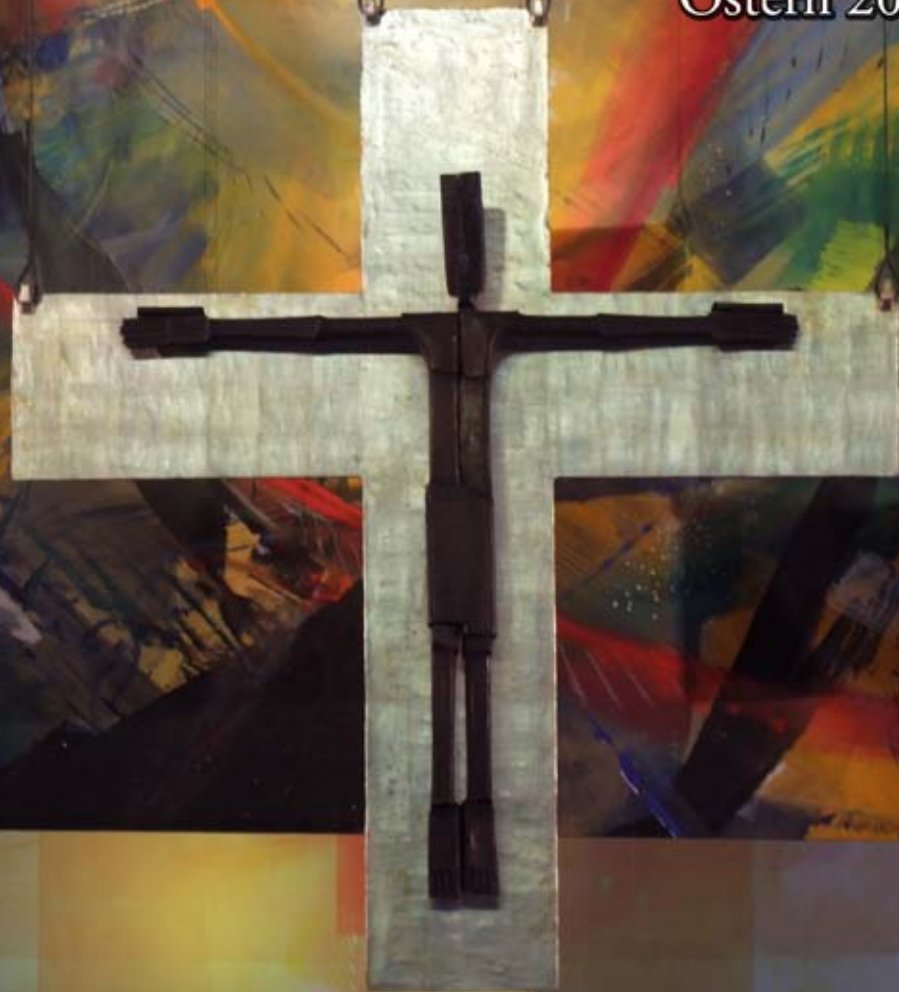
Foto: Das Kreuz der St. Elisabeth-Kirche Hanau vor der Oster-Fähne.

Informationen der Katholischen Pfarrgemeinde St. Elisabeth Hanau Ostern 2012